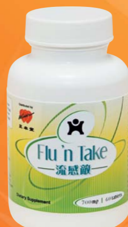
流感敵 免疫系統最佳拍檔 $188