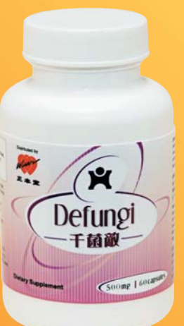
千菌敵 安全可靠抗病毒 $188